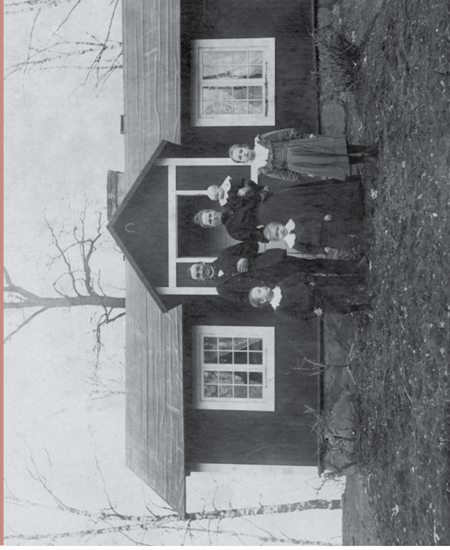
Solstugan i Djursholm.