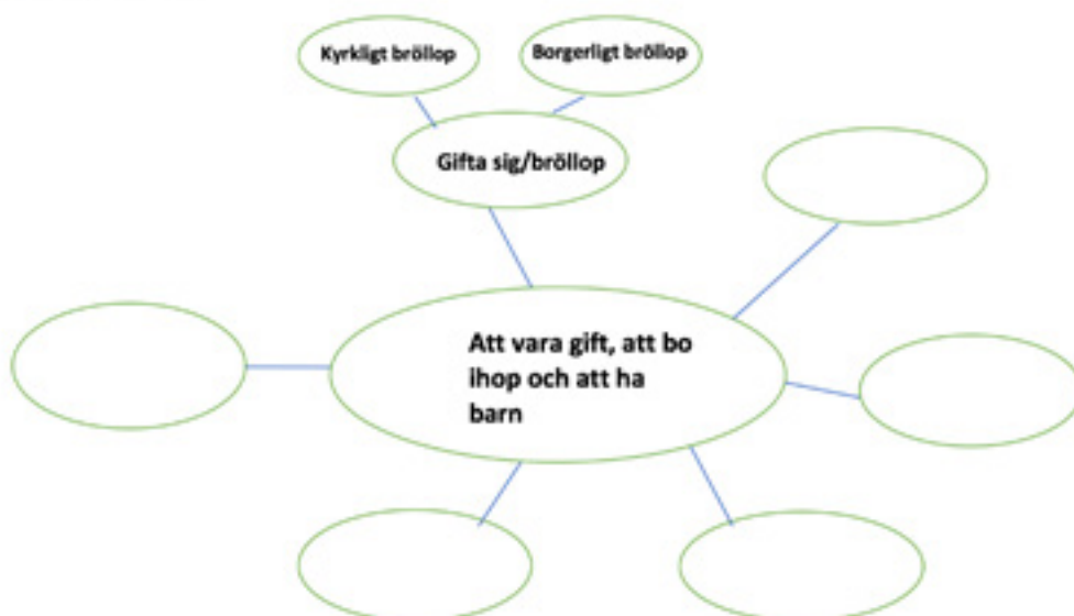
Exempel på tankekarta