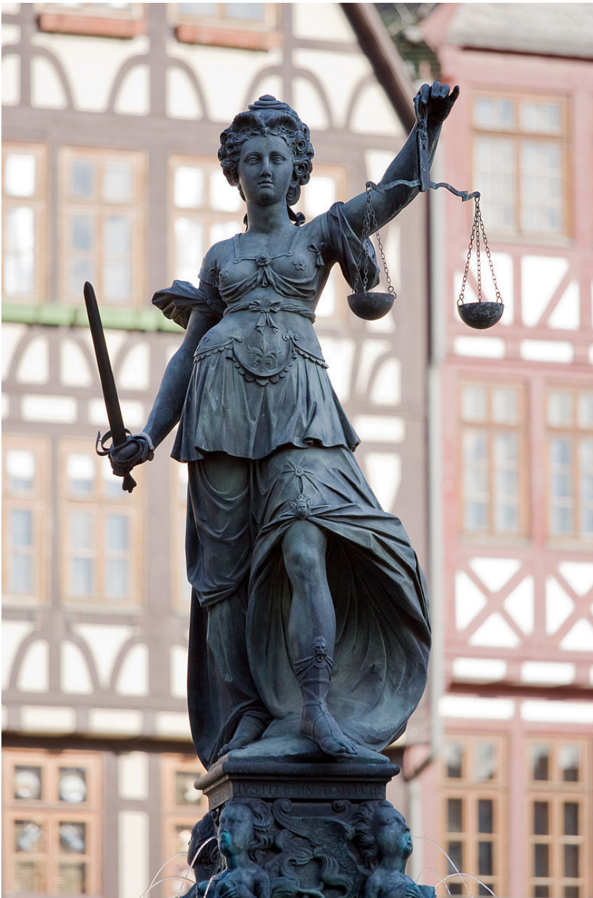
En staty av gudinnan Justitia. Statyn är en del av Gerechtigkeitsbrunnen (Rättvisans brunn) den står på stora torget i gamla staden i Frankfurt i Tyskland.