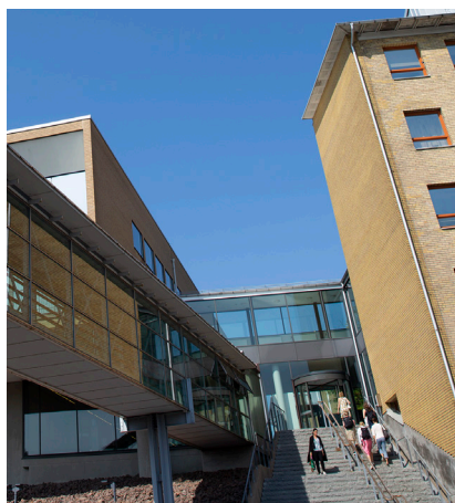
Biomedicinska institutionen vid Göteborgs universitet.