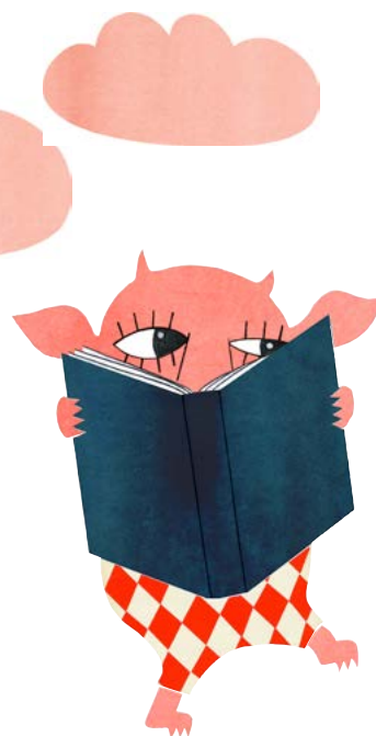
Illustration: Moa Hoff