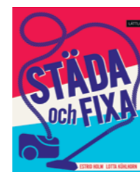
Städa och fixa

Författare: E. Sorbring, L. Löf- gren-Mårtenson & M. Molin ISBN: 978-91-89149-06-9