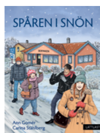
Spåren i snön

Författare: Martin Fallhagen med Lasse Nohrstedt ISBN: 978-91-89149-25-0