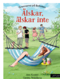
Älskar, älskar inte

Författare: Ann Gomér ISBN: 978-91-88073-95-2