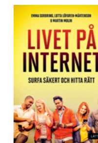
Livet på internet