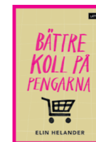
Bättre koll på pengarna

Författare: Anki Tarulinna Johansson ISBN: 978-91-89149-09-0