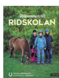
Välkommen till ridskolan

Författare: Helene Lumholdt ISBN: 978-91-89149-01-4