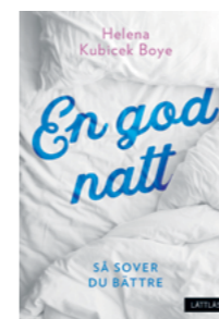
En god natt

Hur kan vi sova bättre? Må bättre? Få bättre koll på vår ekonomi? Och hur funkar internet? Det är alla frågor som påverkar vardagen. LL-förlaget har ett brett utbud av faktaböcker som ger råd och stöd i vardagen, liksom steg-för-steg-böcker om hur du enkelt lagar mat och städar. Och inte att förglömma: sånt som sätter guldkant på vardagen, som bakning och odling!