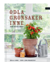
Odlas grönsaker inne

Författare: Mia Öhrn ISBN: 978-91-88073-88-4