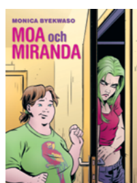
Moa och Miranda

Författare: Wenke Rundberg ISBN: 978-91-88073-90-7