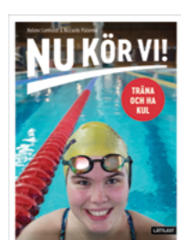
Nu kör vi!

Författare: Marie Albertsson ISBN: 978-91-89149-11-3