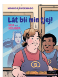
Låt bli min tjej!

Författare: Monica Byekwaso ISBN: 978-91-88073-80-8