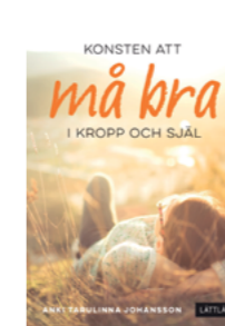
Konsten att må bra

Författare: Helena Kubicek Boye ISBN: 978-91-89149-08-3