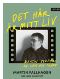
Det här är mitt liv

Författare: Martin Fallhagen med Lasse Nohrstedt ISBN: 978-91-89149-25-0